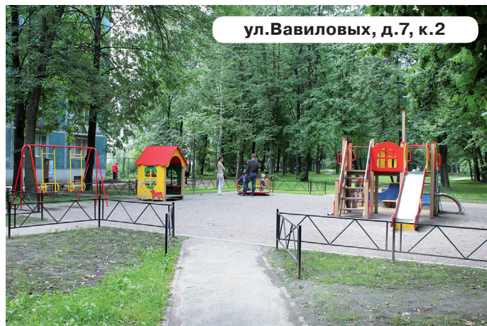
ул.Вавиловых, д.7, к.2

Вы мечтаете о благоустроенном дворе, современной детской и спортивной площадках, красивых газонах и удобных дорожках?