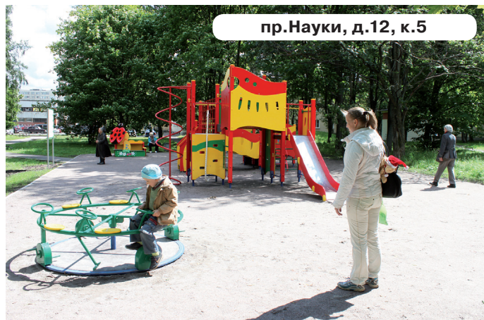
пр.Науки, д.12, к.5