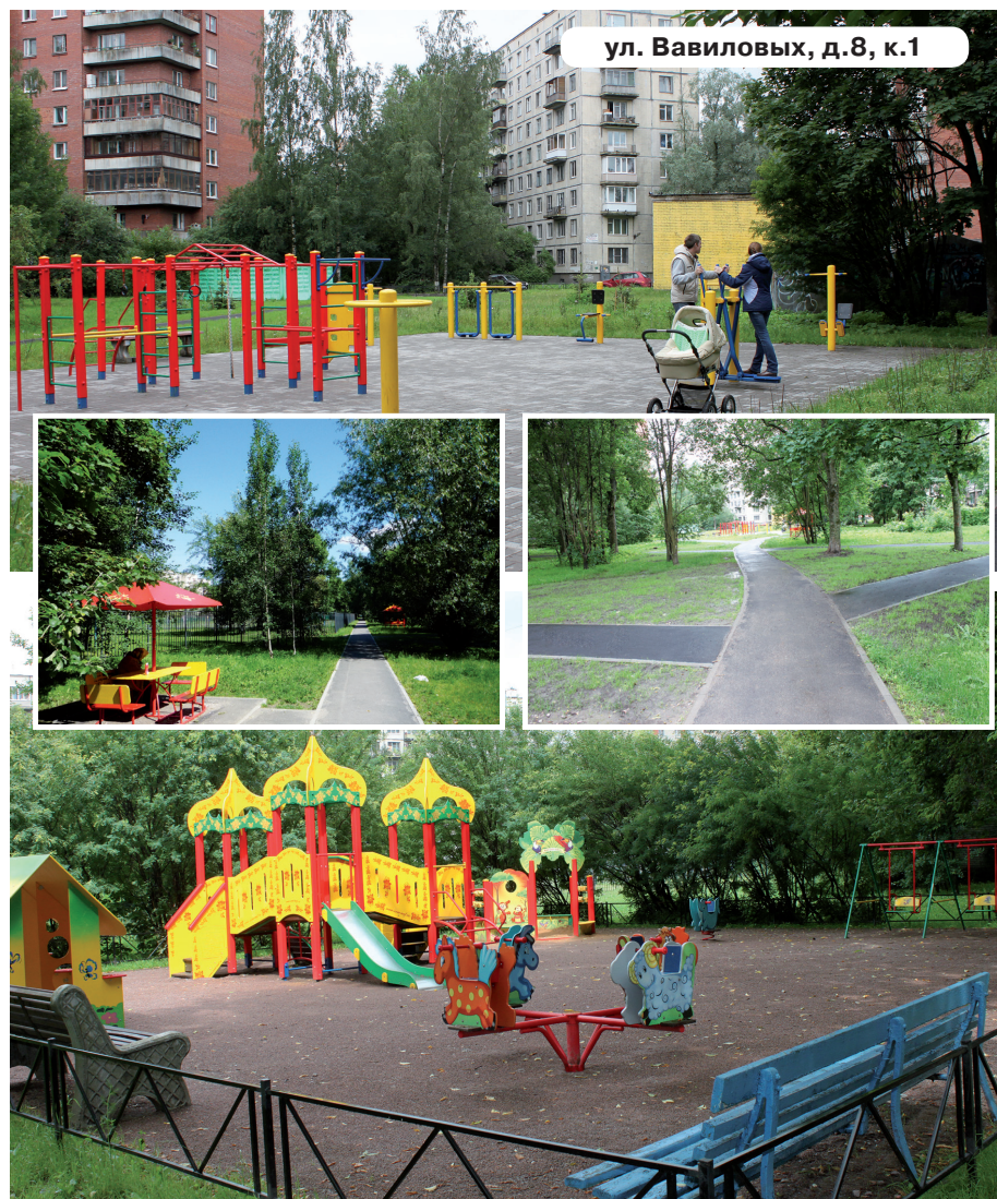
ул. Вавиловых, д.8, к.1

Трудно переоценить роль растений в формировании комфортного дворового пространства, тот уют, который создается благодаря высадке молодых деревьев и кустов. С формальной точки зрения муниципалы могут ограничиться устройством газона, но на деле они идут по другому пути – консультируются с балансодержателями подземных инженерных коммуникаций и озеленителями, где лучше посадить